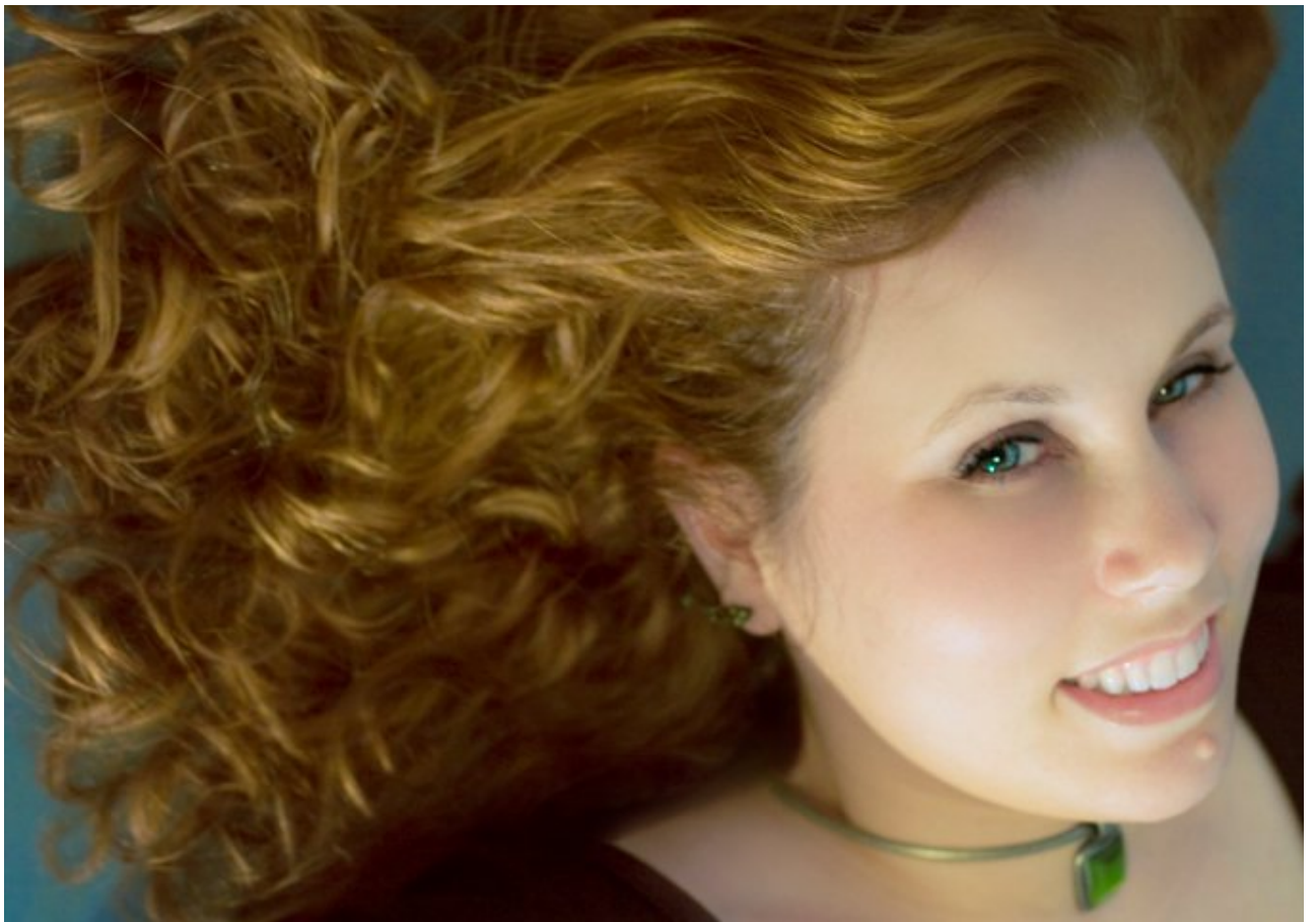
A quien amo.