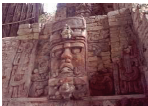
Kohunlich, Quintana Roo

Chetumal también cuenta con el complejo arqueológico Kohunlich.