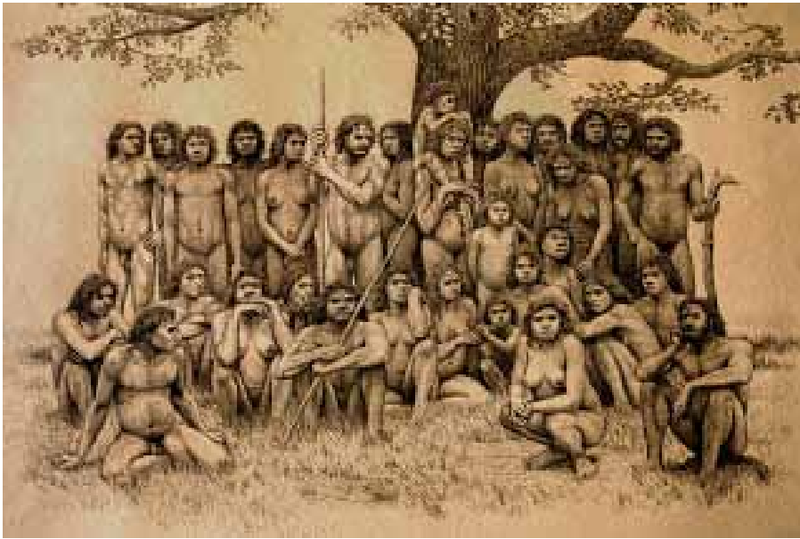
Atapuercan family - artist's impression (From Pilgrimage Day 13: Belorado - Atapuerca DR. Kaare Torgny Pettersen) -

See more at: http://rosarubicondior.blogspot.com.es/#sthash.RZmXkVGc.dpuf