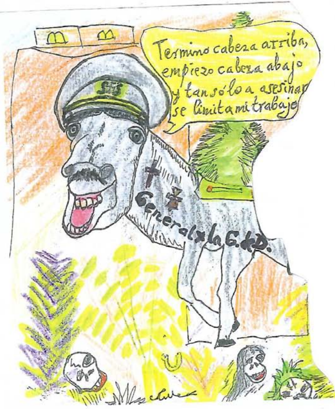
Los Cides de Hoy y de Ayer