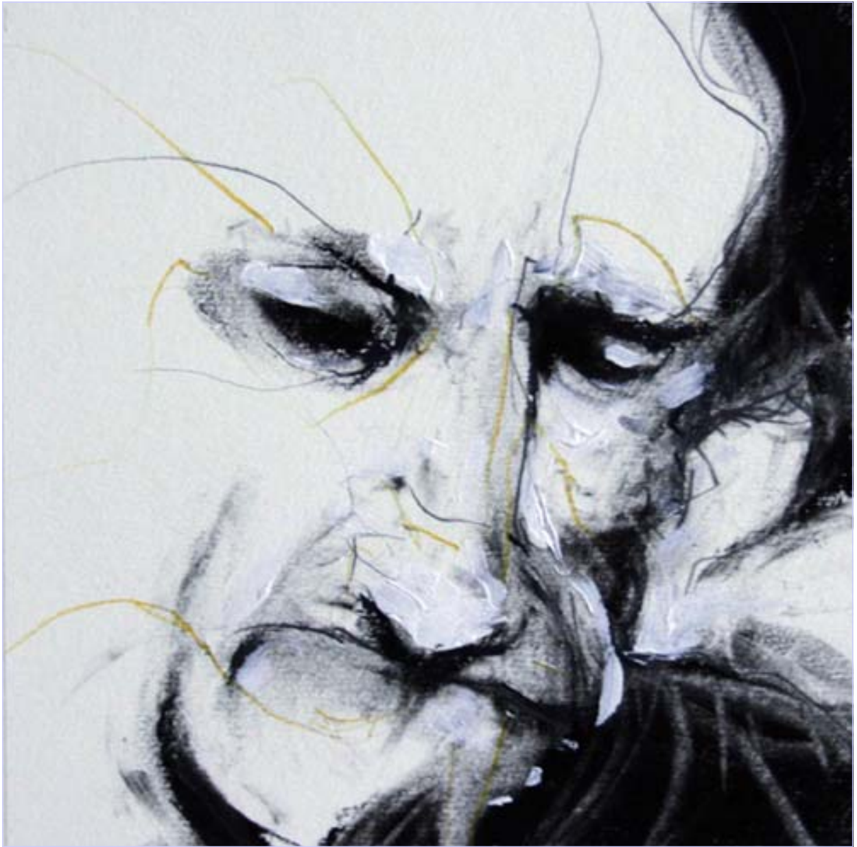
Sans titre - 2009 - 10x10