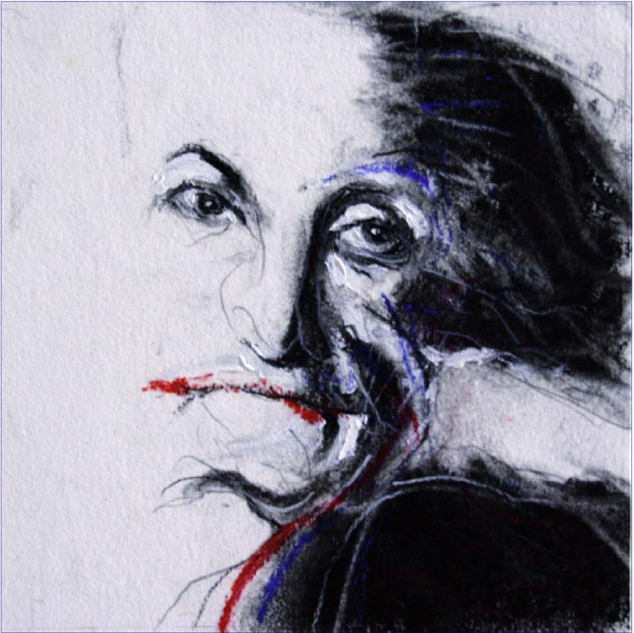
Sans titre - 2009 A3 - 15x15