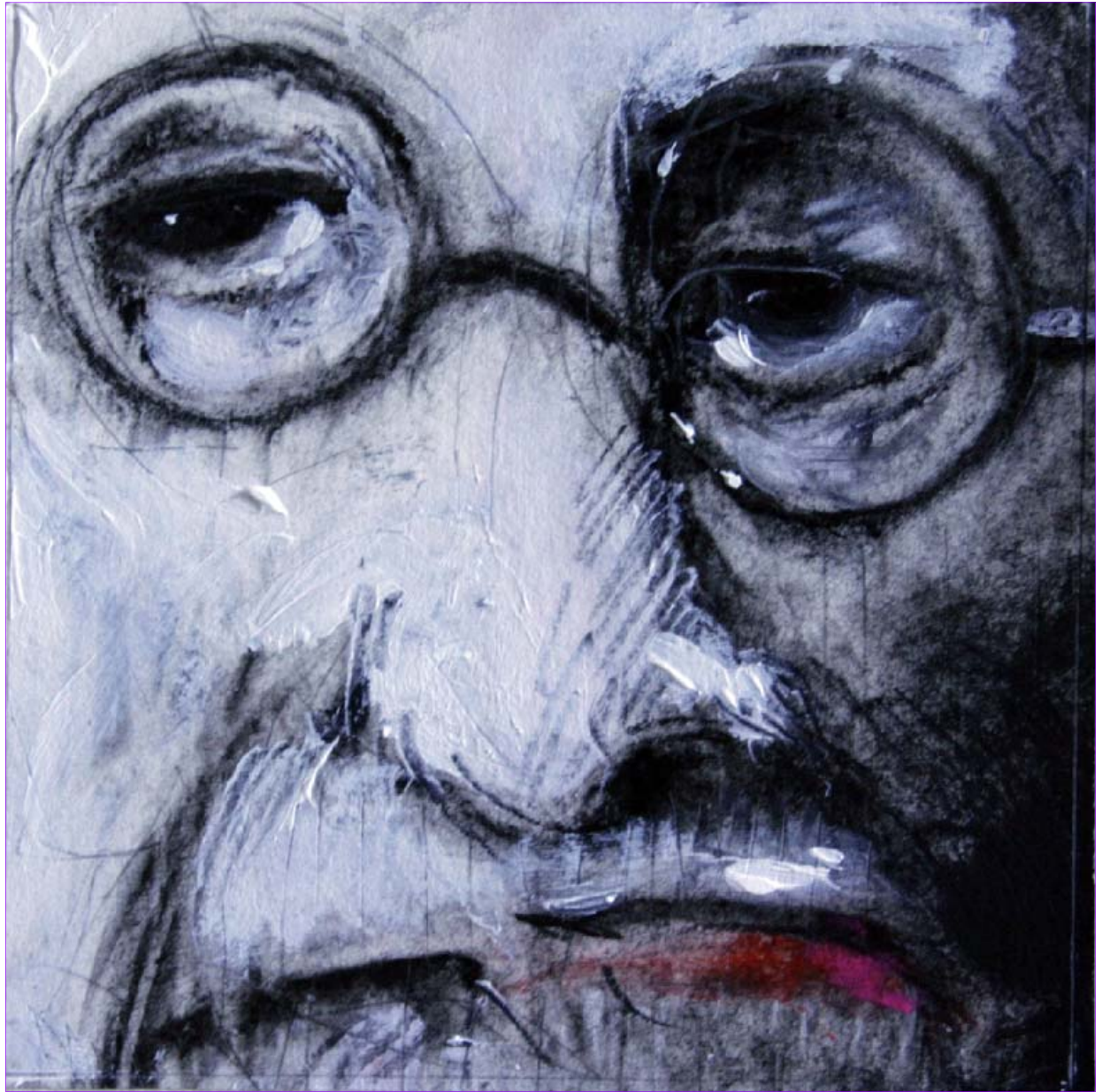
Sans titre - 2009 F2 - 15x15